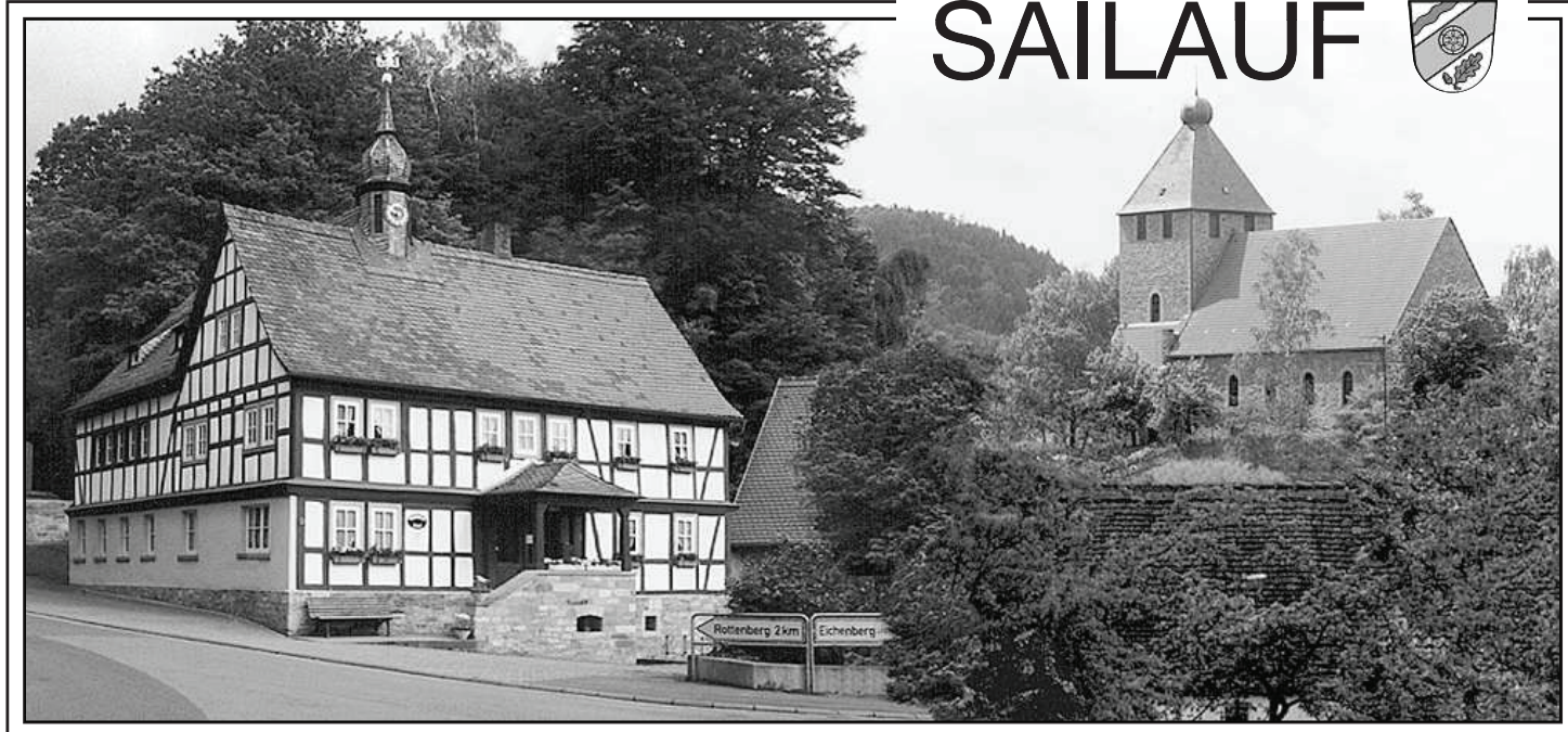
ORTSTEILE: SAILAUF · EICHENBERG